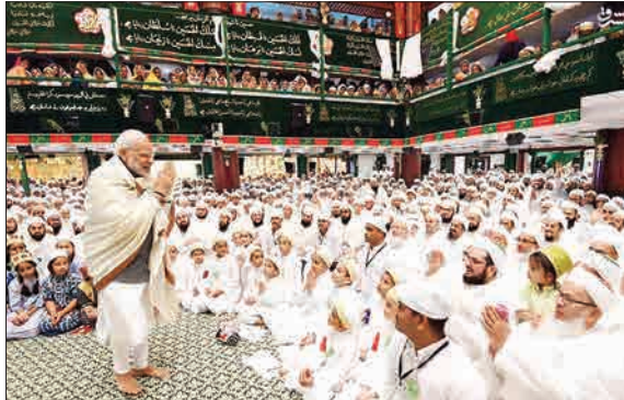
نارندرا مودی، نخست‌وزیر هند با حضور در یکی از مساجد شیعیان در مراسم عزاداری امام حسین علیه‌السلام شرکت کرد و همراه با هم‌میثان مسلمان خود به سوگوارا پرداخت.