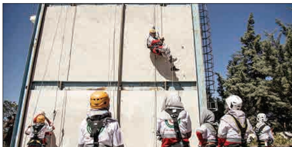
دوره آموزشی توان‌افزایی هلال احمر با حضور ۱۸۰ نفر از نجاتگران زن و مرد در مرکز آموزش‌های تخصصی پایگاه امداد و نجات جاده‌ای کونین استان قزوین برگزار شد. (خبرآنلاین)