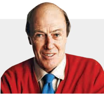
زادروز خالق قصه‌های کودکانه

آبگرمکن، یخچال، فریزر، اجاق گاز و اشیای بلند و بسیار سنگین باید با بست یا تسمه‌های مناسب به کف و دیوار منزل محکم شوند.