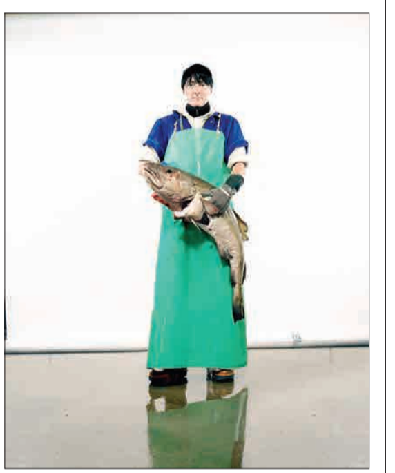
زنی در کارخانه تولید تن ماهی در اسکاتلند مشغول به کار است