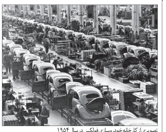
تصویری از کارخانه خودروسازی فولکس در سال ۱۹۵۴