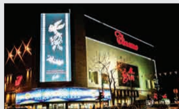
پرندیس سینمایی هویزه مشهد تعداد سالن: ۸ ظرفیت: ۱۱۳۴ درصد از کل فروش: ۳.۶۹