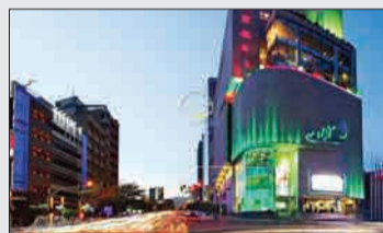
پرندیس سینما آژدی تعداد سالن: ۵ ظرفیت: ۱۱۰۱ درصد از کل فروش: ۵.۹۱