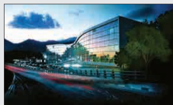
پرندیس سینمایی ملت تعداد سالن: ۵ ظرفیت: ۱۰۸۹ درصد از کل فروش: ۳.۳۷