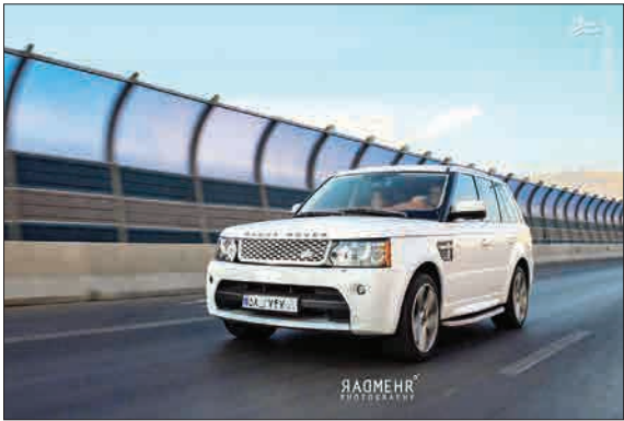
شاسی بلند لوکس انگلیسی در تهران