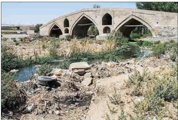
پل تاریخی میر بها، الدین که بر روی زنجان رود با قدمت صد ساله در فهرست آثار ملی به ثبت رسیده، این روزها حال روز خوشی ندارد و اطراف آن به جای گردشگران زیادهای رها شده فرا گرفته است.