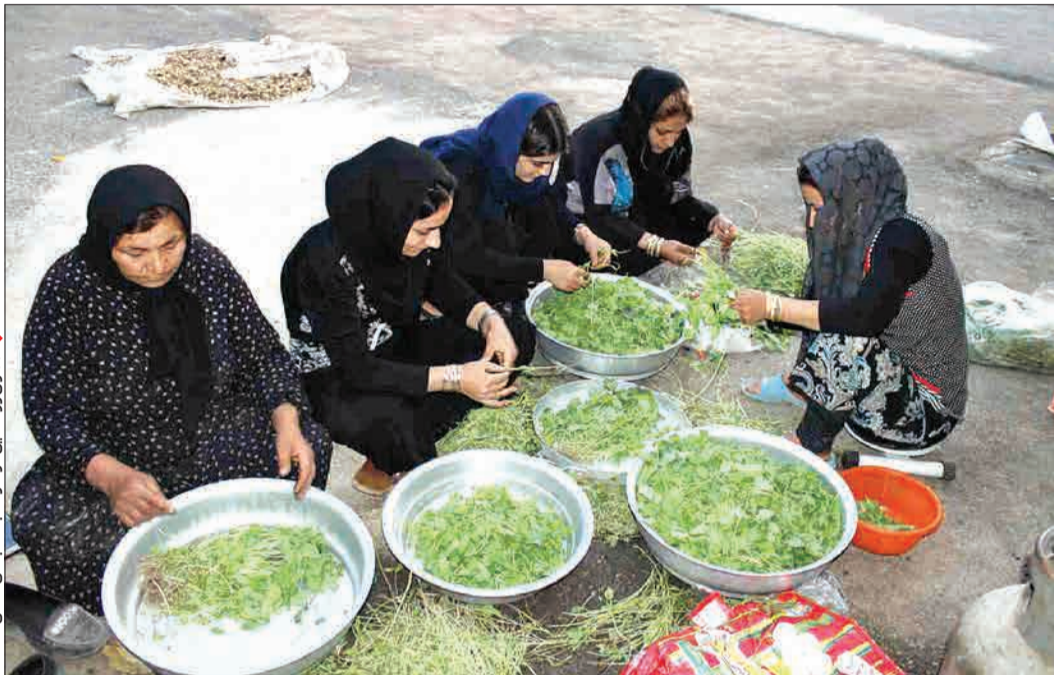
۲۰ زن روستایی در کار بسته‌بندی شامیل شده‌اند

حالا من به اندازه بضاعتم در تبلیغ دین خدا سهم دارم