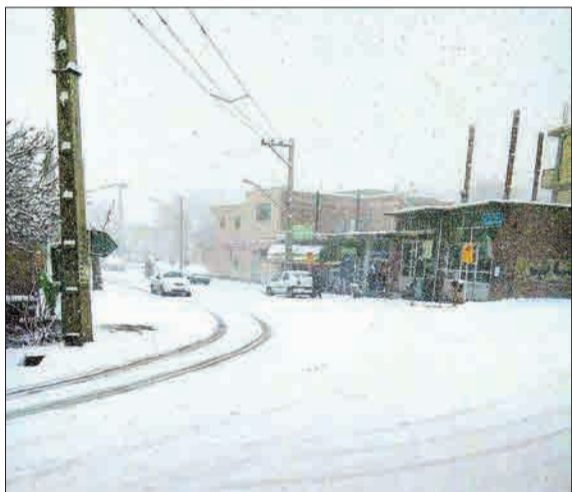
نخستین برف پاییزی اردیبل را سفیدپوش کرد. (خبر آنلاین)

این نوزاد در آمبولانس حویق تلاش در حالی متولد شد که شرایط منطقی بحرانی است و امدادسانی به مردم سیل‌زده به علت تخریب جاده‌ها با کندی صورت می‌گیرد. (مشرق نیوز)