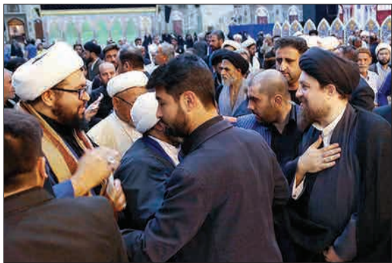
مراسم عزاداری شهادت امام سجاد(ع) در حرم مطهر امام خمینی(ره) (جماران)