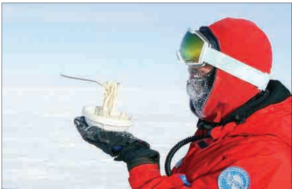
یک دانشمند اروپایی که برای تحقیقات به قطب جنوب سفر کرده با انتشار عکس‌هایی از یخ‌زدن سریع غذای داغ در دمای منفی ۶ درجه سانتیگراد سعی کرد شدت واقعی سرمای این نقطه از زمین را به تصویر بکشد.