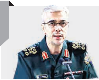
سرلشکر محمد باقری: امنیت کشور خط قرمز ما است

در روزهای پس از بروز یک حادثه، کودکان به حمایت و مراقبت بیشتری نیاز دارند. ممکن است خیلی بترسند و فشار زیادی به آنها وارد شده باشد.