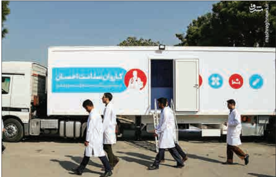
مراسم اعزام کاروان سلامت احسان به مناطق محروم توسط بنیاد برکت صبح روز گذشته برگزار شد.