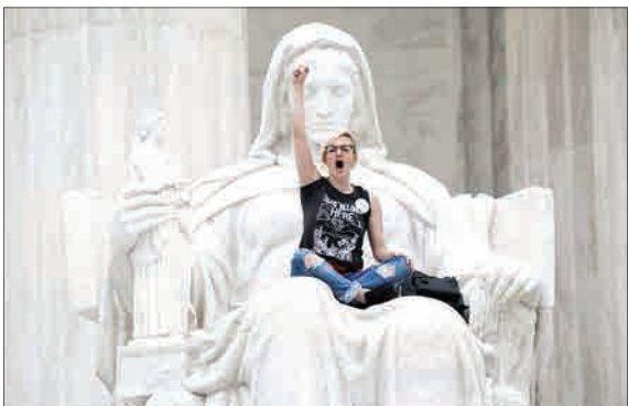
یک زن معترض روی مجسمه دیوان عالی ایالات متحده آمریکا (انتخاب)