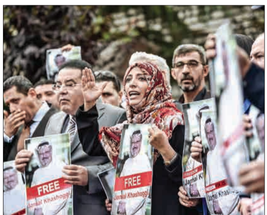
استانبول، ترکیه - توکل کارمان، برنده اسبق جایزه صلح نوبل در وسط تصویر، به همراه عده‌ای دیگر در تجمعی اعتراضی در مقابل کنسولگری عربستان سعودی ایستاده‌اند و تصویری را از جمال خاشقجی، روزنامه‌نگار سعودی کشته‌شده در دست گرفته‌اند.