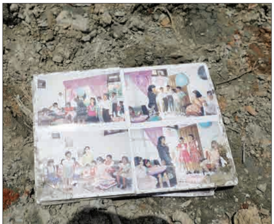
سولائوسی، اندونزی - آلبوم عکس که در کنار خرابه‌های یک خانه روستایی در شهر پالو پس از زمین‌لرزه اندونزی افتاده است.