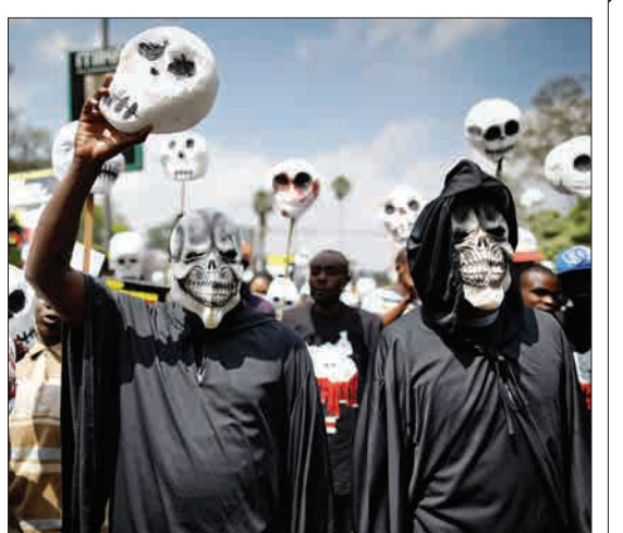
نایروبی، کنیا- فعالان سیاسی با پوشیدن لباس‌های سیاه و ماسک‌های اسکلت به سیاستمداران و رهبران سیاسی سودان جنوبی اعتراض می‌کنند.