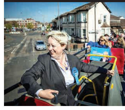
پایان داده است.

خدمات درمانی در حوزه سلامت روان طی سال‌های اخیر در انگلیس بسیار گسترده شده است؛ چراکه تقاضا برای این خدمات افزایش یافته است. پس از درگرفتن بحث‌هایی درباره خروج انگلیس از اتحادیه اروپا نگرانی‌هایی درباره کاهش بودجه این مراکز خدماتی مطرح شده بود. ترزا می اما با این انتصاب نشان داد که قصد دارد بودجه این بخش خدماتی را کاهش دهد. او همچنین اعلام کرد قصد دارد خدمات درمانی در حوزه سلامت روان را در حوزه گودکان و نوجوانان نیز گسترده‌تر کند.