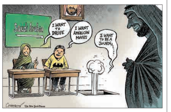
من می‌خواهم روزنامه‌نگار شوم.