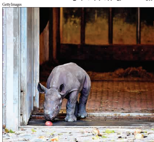
برلین، آلمان- یک کرگدن جوان نخستین قدم‌های خود را در محوطه باغ وحش شهر برمی‌دارد.