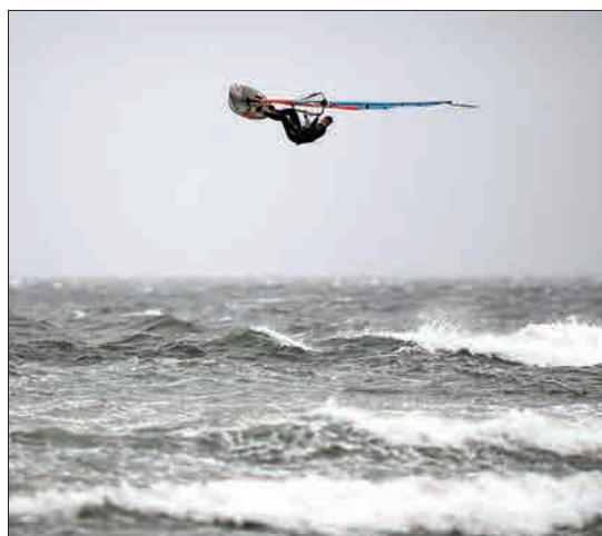
ترو، اسکاتلند- موج سواری در دریای طوفانی