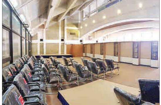
سالن جدید کنفرانس خبری در طبقه دوم ورزشگاه آزادی به منظور افزایش ظرفیت خبرنگاران حاضر در نشست‌های خبری قبل و بعد از مسابقه پیش از فینال آماده خواهد شد.