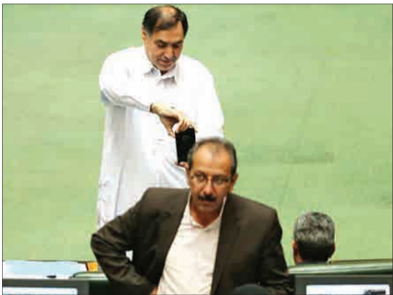
عکاسی خاص آقای نماینده در مجلس (ایرنا)