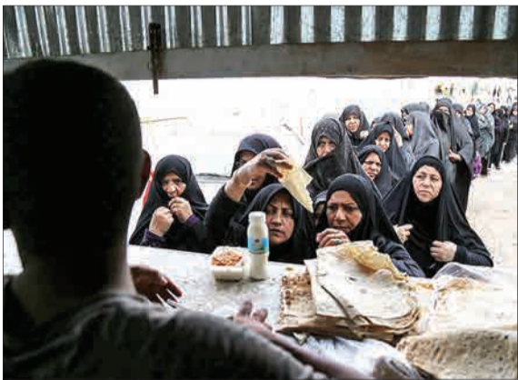
بازگشت زائران اربعین حسینی از مرز چاب‌آباد