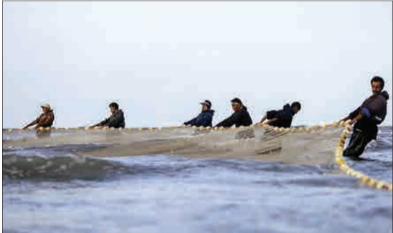
ماهیگیران با تورهایشان به کنار دریای خزر آمده‌اند. فصل ماهیگیری آغاز شده و ماهیگیران برای صید به دریا می‌زنند. فصلی که از ۲۰ مهرماه آغاز شده است و تا ۱۵ فروردین سال آینده ادامه خواهد داشت.