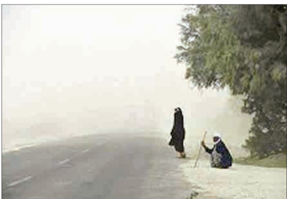
در هفت‌ماهه نخست امسال، تعداد روزهای همراه با طوفان گرد و خاک در زابل نسبت به مدت مشابه سال قبل ۵۰ درصد افزایش یافته است.