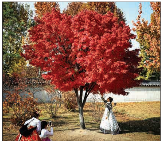
سئول، کره جنوبی - در یکی از روزهای پاییز، زنان لباس‌های سنتی می‌پوشند و عکس می‌گیرند.