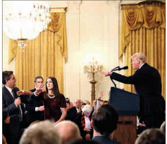
لحظه درگیری لفظی ترامپ با خبرنگار سی‌ان‌ان. یکی از کارکنان کاخ سفید تلاش می‌کند مایکروفر را از دست خبرنگار بگیرد.