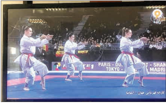
بمانکنید این کارها را یک روز زان را به استاد بومر همی دهید، خبری از داستانی و تهدید زور نمی شود. همه از این که پاهای بانوان قانونی به آزادی باز شده است و آبروی ایران هم حفظ شده، خوشحال و راضی اند. باور کنید این سرخوشی (ولو کوچک و منتخب) برای یک ماه ماکافی است... حالا برداشته اید در یک اقدام خودجوش و بی اعصاب قبلی، کار آهسته بانوان را در شبکه ورزش پوشش داده اید؟