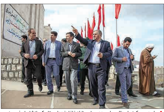
واحد مسکونی احداثی برای مدجویان مناطق زلزله زده استان کرمانشاه با حضور رئیس کمیته امداد امام خمینی (ره) در شهرستان های سرپل ذهاب، گیلانغرب، قصر شیرین و دالاهو افتتاح شد. (مشرف)