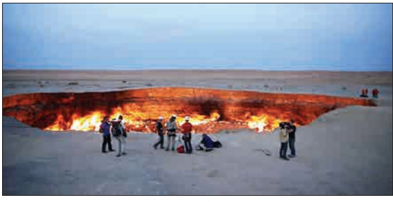
حدود چهل سال پیش یک حفره بزرگ به نام دروازه جهنم یادروازه دوزخ در کنار روستای دروازه در فرقوم، استان آخال ترکمنستان به وجود آمد. این میدان گازی که ۶۹ متر عرض و ۳۰ متر عمق دارد از همان زمان در حال سوختن است. (خبر آنلاین)