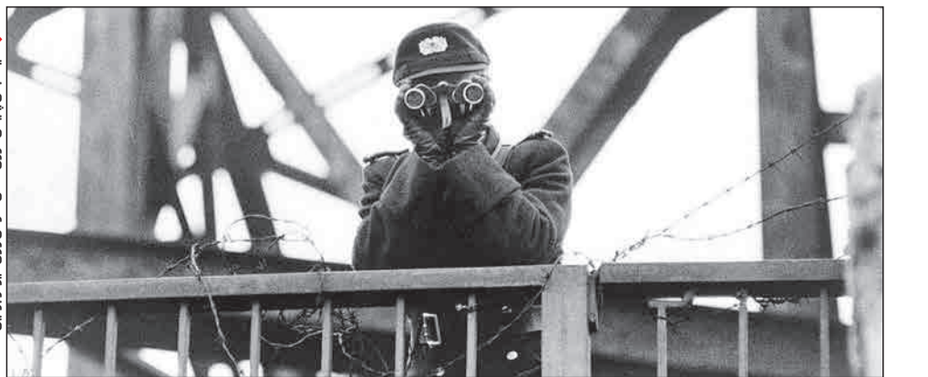
جبهه‌های پلیس شرقی آلمان شرقی روی دیوار برلین - ۱۹۶۱