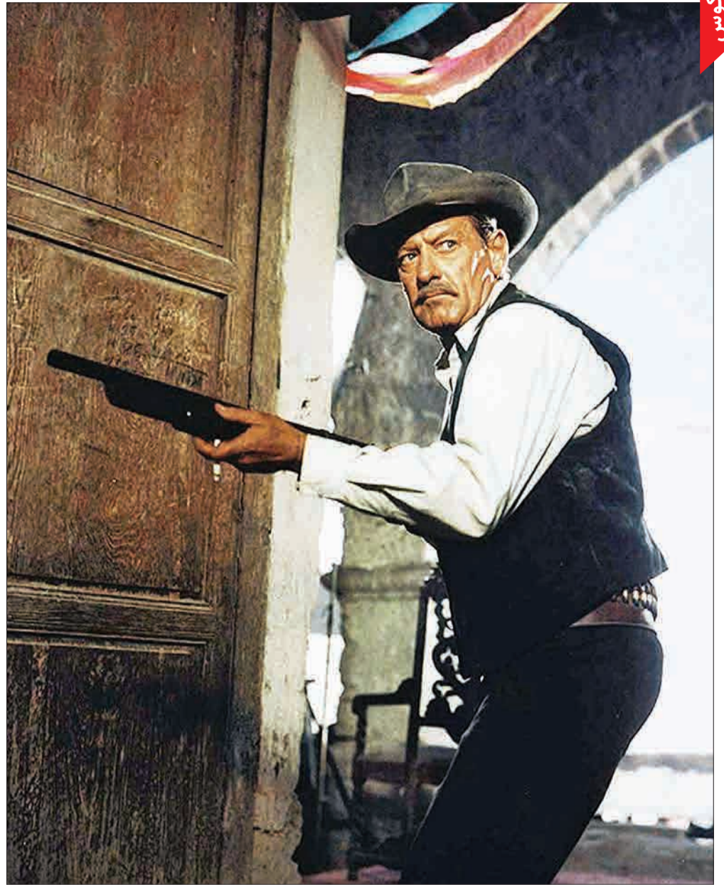
ویلیام هولدن در صحنه‌ای از فیلم «این گروه خشن» ساخته سم پکینیا - ۱۹۶۹ ۲۷ سال پیش در چنین روزی (۱۲ نوامبر ۱۹۸۱)، ویلیام هولدن، بازیگر شهیر سینمای جهان در سن ۶۳ سالگی در گذشت. در کارنامه او نقش آفرینی در آثار مهمی چون «سانست بولوار»، «باز دانشگاه شماره ۱۷»، «سابرینا»، «پل رودخانه کوا»، «این گروه خشن»، «طالع نحس» و همکاری با کارگردان سرشناسی چون بیللی وایلد، سم پکینیا، جرج کیو، رابرت مینجر، رابرت وایز، جان استر جز، دیوید لین و... به چشم می‌خورد.

مقاومت جانانه ژاپن در برابر نیروهای متفقین با لهیب انفجار دو بمب اتمی در هیروشیما و ناگازاکی شکسته شد و چشم‌بادامی‌ها که خود را بازنده جنگی نابرابر - سلاح متعارف در برابر سلاح نامتعارف - می‌دیدند، برای نجات نسل‌های بعدی دست از مقاومت برداشتند. یکی از کسانی که بعد از تسلیم ژاپن به نیروهای متفقین دستگیر و تحویل دادگاه نظامی شد؛ ژنرال توجو هیدکی، نخست‌وزیر ژاپن در دوران جنگ جهانی دوم بود. متفقین هیدکی را یک ناسیونالیست افراطی می‌دانستند و با وجود در اختیار داشتن پست نخست‌وزیری، انداختن تقصیر جنایت‌های جنگی به گردن او کار سختی نبود. توجو هیدکی ۷۰ سال پیش در چنین روزی (۱۲ نوامبر ۱۹۴۸) از دادگاه جنایات جنگی متفقین حکم مرگ گرفت. این حکم ۴۰ روز بعد اجرا شد.