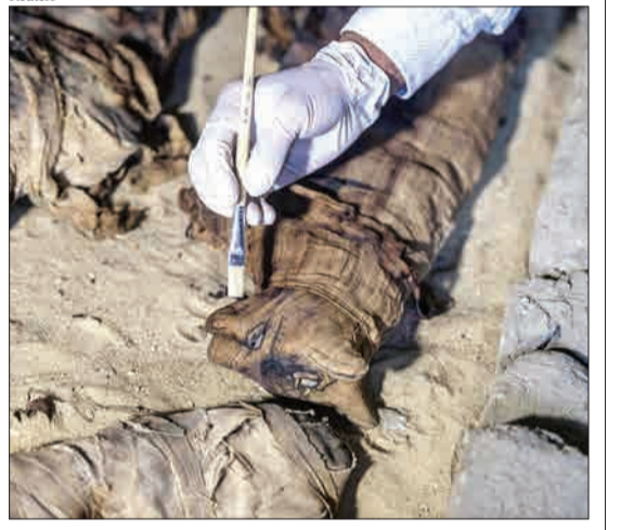
سقاره نکر و پولیس، مصر - باستان شناس مصری در حال پاک کردن مومیایی یک گربه است که در نزدیکی هرم پادشاه اوسر کاف پیدا شده است.