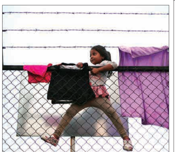
کوتر تارو، مکزیک - دختر مهاجر ۵ ساله هندوراسی که از فنس بالا می رود.