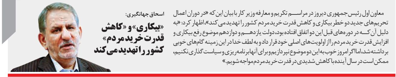
اسحاق جهانگیری: «بیکاری» و «کاهش قدرت خرید مردم» کشور را تهدید می کند

معاون اول رئیس جمهوری دیروز در مراسم تکریم و معارفه وزیر کار با بیان این که «در دوران اعمال تحریم های جدید دو خطر بیکاری و کاهش قدرت خرید مردم کشور را تهدید می کند»، اظهار کرد: «به دلیل آن که در دوره های قبل این دو اتفاق افتاده بود، دولت یازدهم و دوازدهم موضوع رفع بیکاری و افزایش قدرت خرید مردم را از اولویت های اصلی خود قرار داد و به لطف خدا در این زمینه گام های خوبی برداشته شد، اما اگر امروز خوب به این دو موضوع نپردازیم و برای آنها برنامه ریزی و سیاست گذاری نکنیم، ممکن است در سال آینده با کاهش شدیدی در قدرت خرید مردم مواجه شویم.»