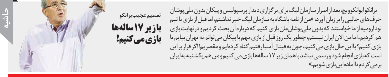
تصمیم عجیب بر آنکو بازی می‌کنیم! بازی ۱۷ ساله‌ها