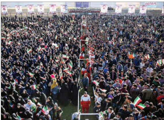
استقبال مردم شاهرود از روحانی، (جماران نیوز)