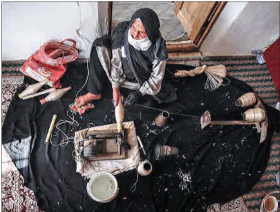
روستای بسک در فاصله ۲۴ کیلومتری شهرستان تربت حیدریه و در استان خراسان رضوی واقع شده است. جمعیت آن حدود پنجاه خانوار است و شغل اصلی‌شان از دیرباز ابریشم‌کشی و تولید رشته‌نخ‌های ابریشمی است. امسال اما برای تولید این نوع ابریشم با مشکل کمبود آب مواجه هستند.