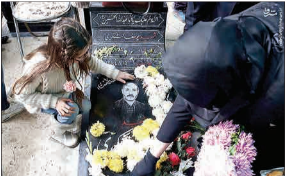
مراسم بزرگداشت شهدای اصحاب رسانه روز گذشته بر سر مزار پاک این شهدا با حضور خانواده‌هایشان و جمعی از مردم و مسئولان برگزار شد.