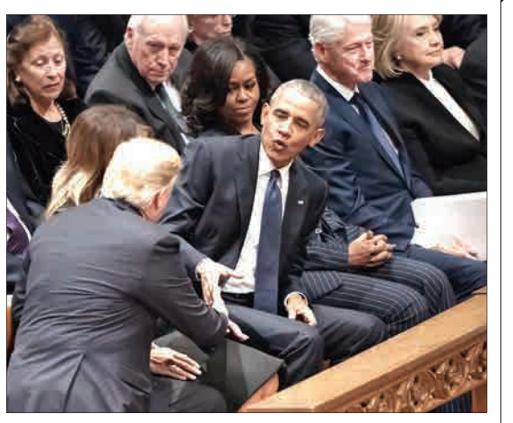
مراسم تدفین جورج هربرت دبلیو. بوش، رئیس‌جمهوری سابق ایالات متحده آمریکا در کلیسای مرکزی. روسای جمهوری قبلی باراک اوباما، بیل کلینتون و جیمی کارتر در کنار دونالد ترامپ و ملانیا ترامپ نشستند.