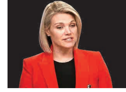
شائس بزرگتر ناوترت این بود که یکی از طرفداران پروپاقرص این برنامه بعدا رئیس‌جمهوری آمریکا شد و هنوز هم روزی چند ساعت این برنامه را نگاه می‌کند و از این برنامه می‌آموزد یا خط می‌گیرد. ویژگی اصلی ناوترت وفاداری عمیق و خالصانه‌اش به ترامپ و دوستی نزدیکش با ایوانکا ترامپ است. به علاوه بلندپروازی‌های نیکی هیلی را هم ندارد که از نظر ترامپ یک مزیت است. برخی وی را فاقد عمق بینش سیاسی لازم برای چنین پستی دانسته‌اند. همسر ناوترت از بانکداران با سابقه گروه گلدمن-ساکس است و این نظر به‌راکه حلقه اصلی ترامپ را فعالان فاکس نیوز یا گلدمن ساکی تشکیل می‌دهند، تقویت می‌کند.

برخی منابع می‌گویند از آن‌جا که خاستگاه ناوترت رسانه بوده، وجهه مثبتی در رسانه‌های آمریکایی دارد. او چند سال خبرنگار ای بی سی نیوز بود و جایزه امی را هم تصاحب کرد، ولی ستاره اقبال وی از سال ۲۰۱۲ و بعد از پیوستن به برنامه محبوب Fox and friends شروع به درخشیدن کرد.