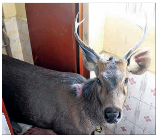
شیملا، هند - یک گوزن در توالیت یک مدرسه گیر افتاده بود. این گوزن در طبیعت اطراف زادش.