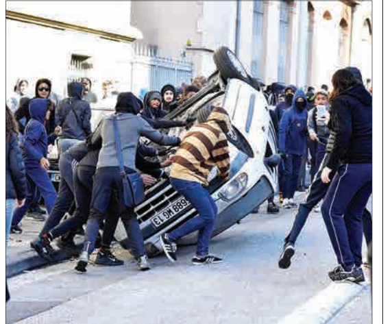
مارسی، فرانسه - معترضان در فرانسه، یک خودرو را چپ کردند.