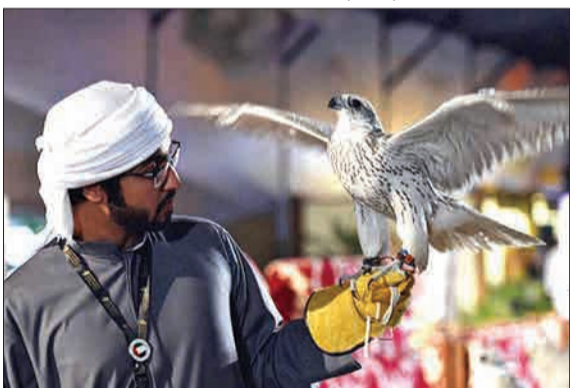
تفریح با پرندگان شکاری میراث حیوانات بی‌رحمی علیه حیوانات است. با وجود اعتراضات مختلف نسبت به این امر، در ریاض پایتخت عربستان سعودی نمایشگاه شاهین‌های شکاری برپا شده است. (فرارو)