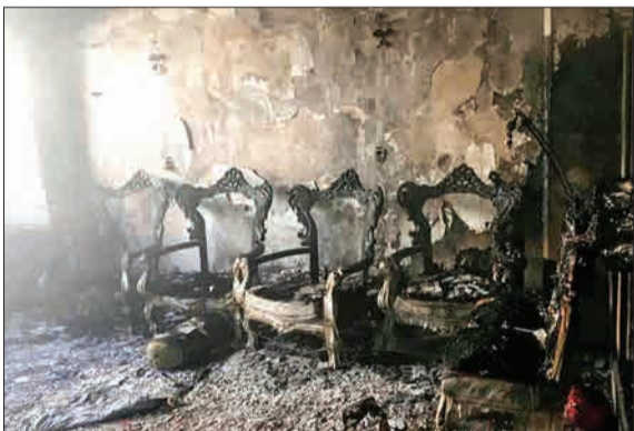
خانه‌ای لاکچری در شیراز سوخت و به خاکستر نشست. خوشبختانه این حادثه مصدومی نداشت.