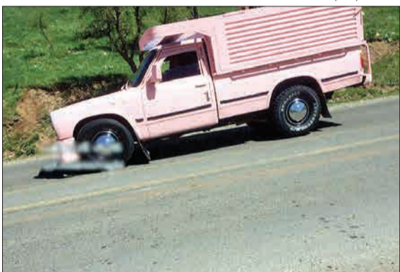
نیسان صورتی هم آمد! (مشرق)