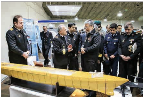
نمایشگاه توانمندی‌ها و دستاوردهای فنی و تخصصی ندادا صبح دیروز با حضور امیر دریادار حبیب‌الله سیاری معاون هماهنگ‌کننده ارتش و امیر حسین خانزادی فرمانده نیروی دریایی ارتش افتتاح شد. (مهر)