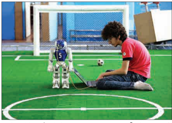
مسابقات روباتیک آسیا-اقیانوسیه ۱۸ و ۲۰ حضور شرکت‌کنندگان ۱۵ کشور در کیش آغاز شد.