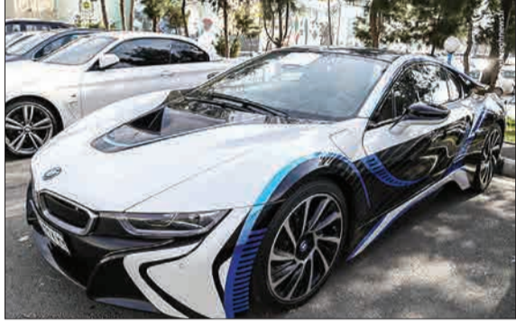
نخستین مرحله از طرح ظاهر با هدف ارتقای انضباط ترافیکی و ایمنی ترافیکی در تهران با تلاش مأموران راهنمایی و رانندگی تهران بزرگ طی روزهای گذشته اجرا شد که در این طرح ۱۳۵۷ خودرو متوقف شدند. (مشرق)