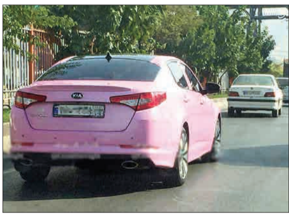
پدیده خودروهای صورتی گویا در حال گسترش است. حال تصویری از خودروی اپتیما با رنگ صورتی در تهران می‌بینید.