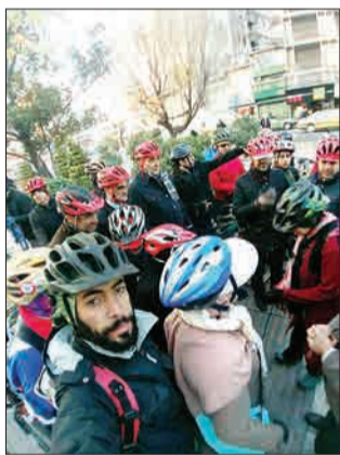
در «سمنه‌های بدون خودرو»، شهروندان تهرانی با شهردار هم‌کاب شدند. (عصرایران)

نامهای از مجرای تقدیر رئیس‌دانشگاه فردوسی از خودش در شبکه‌های اجتماعی منتشر شده‌اند و توضیحاتی درباره این نامه‌ها گفت: «متأسفانه به دلیل عجله‌ها و عوامل اجرایی، از بنده خواسته شد که لوح‌ها را امضا کنم و پس از آن اسامی برگزیدگان توسط هیأت‌مدیران هریکشان وارد شده است. لذا درج نام رئیس دانشگاه فردوسی در یکی از این لوح‌ها، بعد از امضای بنده اتفاق افتاده است. البته این موجب تاسف خودم نیز شده، اما بی‌دقتی برخی از عوامل اجرایی خارج از دانشگاه موجب این اتفاق نامطلوب شده است.» (ایستا)