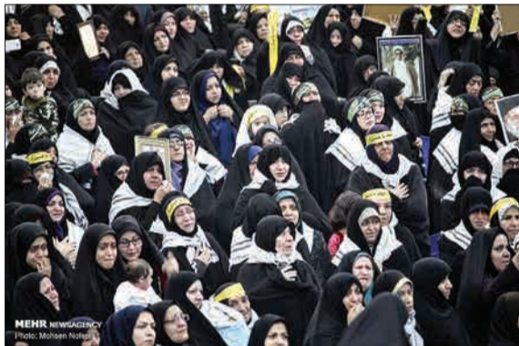
اجلاس ۲ هزار شهید خراسان جنوبی با حضور محمدعلی جعفری، فرمانده کل سپاه پاسداران انقلاب اسلامی، تولیت آستان قدس رضوی و تنی چند از مسئولان استانی و کشوری در بیرجند برگزار شد.