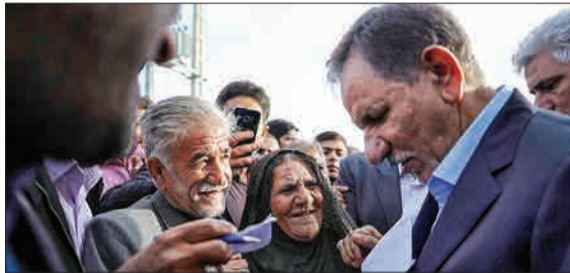
اسحاق جهانگیری، معاون اول رئیس‌جمهوری دوشنبه ۱۹ آذر ماه، برای بازدید و افتتاح چند طرح و پروژه مهم صنعتی، اقتصادی و عمرانی از طریق فرودگاه بین‌المللی بندرعباس وارد استان هرمزگان شد.