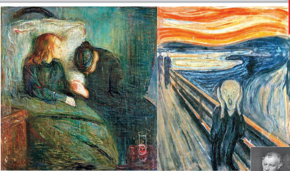
«جیج» (۱۸۹۲) و «کودک بیمار» (۱۸۹۶)، دو اثر معروف ادوارد مونک

۱۵۵ سال پیش در چنین روزی (۱۲ دسامبر ۱۸۴۲)، ادوارد مونک نقاش شهیر نروژی و از هنرمندان برجسته سبک اکسپرسیونیسم (هیجان‌نمایی) در آدلسبورگ به دنیا آمد. «جیج» معروف‌ترین اثر مونک و یکی از شاهکارهای هنر مدرن است.