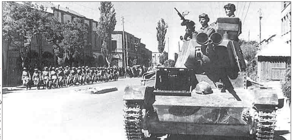
تنگنا در تنش سرخ در خیابان‌های تبریز

خاطره جدا شدن ۱۷ شهر قفقاز در زمان فتحعلی‌شاه و الحاق آن به روسیه آن قدر به مذاق روس‌های سرخ خوش آمده بود که نتوانستند پس از پایان جنگ جهانی دوم به قول و قرار خود در کنفرانس تهران عمل کرده و شمال ایران خصوصاً آذربایجان را تخلیه کنند. استالین می‌دانست که دیر یا زود مجبور است پای حرفی که زده بایستد و بر اساس توافق سه‌جانبه تهران به پشت‌مرزهای برود، پس به این فکر افتاد که با بر سر کار آوردن یک حکومت جعلی و دست‌نشانده که خود را پست‌ادعای شیک استقلال طلبی پنهان کرده، به