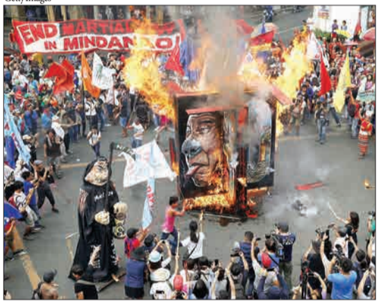
مانیل، فیلیپین- معترضان که در سالگرد اعلامیه جهانی حقوق بشر، در نزدیکی کاخ ریاست جمهوری، علیه سیاست های رودریگو دو تره، رئیس جمهوری فیلیپین جمع شده اند و عکس اورا آتش می زنند.