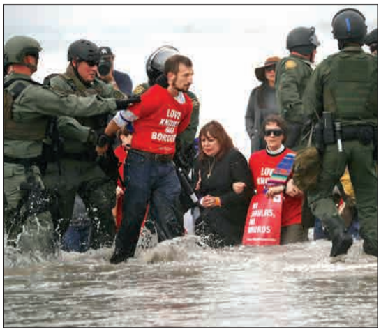
سن دیه گو، کالیفرنیا، آمریکا- نیروهای مرزی آمریکامردی را که در دفاع از حضور یک کاروان پناهجویان از مکزیک در تجمعی حضور پیدا کرده بود، بازداشت می کنند.