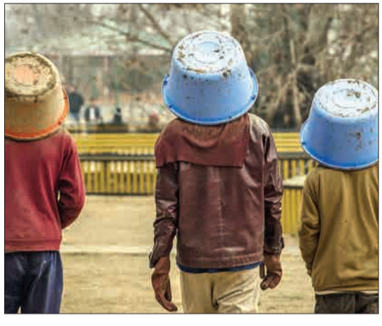
سریناگار، کشمیر هند- کارگران کشمیری پس از یک روز کاری خسته کننده از الکترونیک خاک رودخانه برای یافتن طلا هوا بسیار سرد است و در بسیاری از مناطق کشمیر به زیر صفر رسیده است.