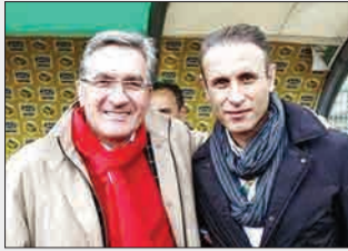
چه کسی قهرمان نیم فصل می شود؟

آخرین مسابقات لیگ برتر در پایان نیم فصل اول امروز، فردا و شنبه برگزار می شود که جنگ بر سر قهرمانی نیم فصل است. در این بازی امروز استقلال و پدیده در ورزشگاه آزادی به مصاف هم می روند که مسابقه حساسی است. همچنین فردا پرسپولیس در دیدار با پارس جنوبی جم میزبانی می کند که تقابل تاز و سرخ پوشان جذاب به نظر می رسد. همچنین سپاهان نیز روز شنبه میهمان استقلال خوزستان است. در حال حاضر سپاهان و پدیده ۳۰ امتیاز دارند و پرسپولیس با ۲۸ امتیاز در رده سوم قرار گرفته است؛ به همین خاطر این ۳ تیم برای قهرمانی نیم فصل با هم رقابت خواهند کرد.