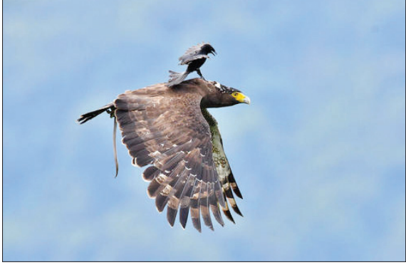
سوارگری گرفتن از عقاب در تایوان. این عکس کم‌نظیر را «لیو جیا پین» عکاس حیات وحش تایوانی گرفته است. (رویداد ۲۴)