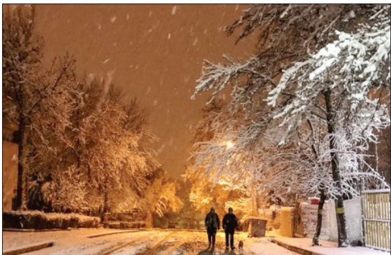
تصاویر زیبایی از نخستین شب برفی تهران. (ایستا)