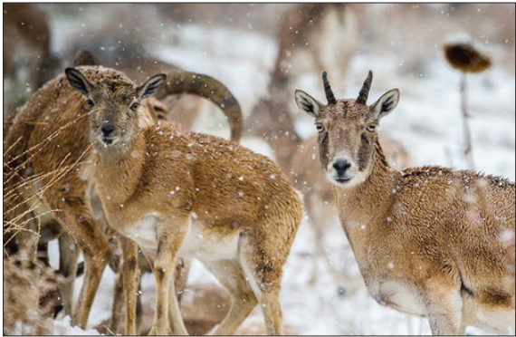
ورجین یکی از مناطق حفاظت‌شده در اطراف تهران است که در فصل زمستان مامن حیواناتی می‌شود که برای پیدا کردن غذا از ارتفاعات به سمت دامنه‌های کوه می‌آیند. اگر در زمستان به این منطقه بروید، انبوهی از قوچ، میش و کل را خواهید دید که برای خوردن علوفه به ورجین می‌آیند. (ایستا)