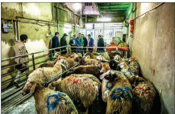
کشت مشترک تعزیرات حکومتی براساس اعلام گزارش از منطقه ۱۵ شهرداری مینی بر نگهداری و کشتار گوسفندان در پارکینگ‌های منازل مسکونی، از این واحدها بازدید و دستور تخلیه صادر کرد. (میزان)