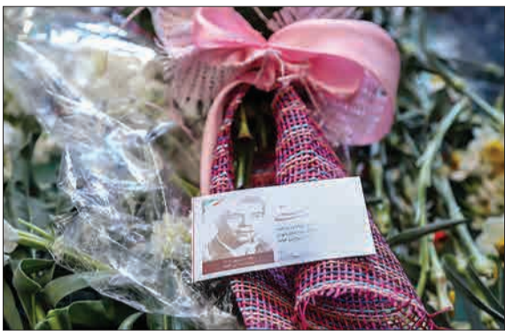
پنجاهویکمین سالگرد درگذشت جهان‌پهلوان تختی در این بابویه.