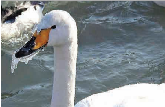
در این تصویر، یخ زدن نوک قو در پارکی در بوجوا - چین - در دمای ۲۰- درجه سانتیگراد را می‌بینید.