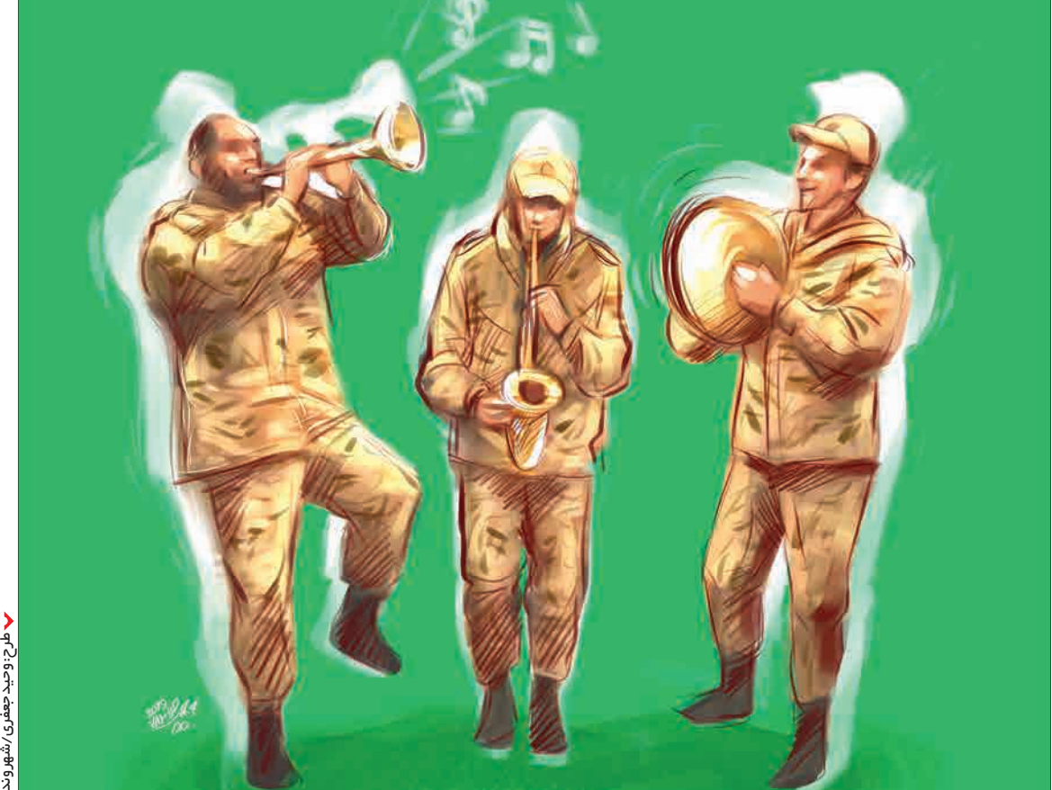
طرح و مجسمه جعفری / شهر وند

کلیپ ۴۹ ثانیه‌ای که تصویرش را حتما در کانال هادیده‌اید، خلاصه همه آن چیزی است که از روزگار خودمان می‌خواهیم؛ چند جوان که در این سن و سال باید پر از انرژی باشند، دارند از فراغت پیش آمده (لابد در حاشیه برنامه‌ای) استفاده می‌کنند و با همان آلات موسیقی نظامی، می‌زنند و دور هم شاد شادند. در داور اینجاست؛ نخستین گزاره‌ای که به ذهن همه ما می‌رسد و در قالب کلمت و پست اظهارش کرده‌ایم، ترس از توبیخ و جریمه این جوان‌های خوشحال است؟ مگر این بچه‌ها چه می‌کنند؛ محیط آسایشگاه را به هم ریخته‌اند، حرمتی شکسته‌اند و کار نادرستی انجام داده‌اند، بی‌اجازه کاری کرده‌اند یا موسیقی غیر مجازی را سوزو نوازندگی کرده‌اند؟ نه! آنها دارند با یکی از نوستالژیک‌ترین موسیقی‌های گروه مجاز و مرحوم آریان شادی می‌کنند، یکی شان لی‌لی کنان دیگران را به خنده و می‌دارد و دیگری شان، ضرب‌های درامش را تا روی زمین ادامه می‌دهد. چه چیزی از دیدن این شادی‌ها، ارزشمندتر است؟ اصلا چرا باید برای این سر بازاها -که گویا سر بازی‌شان هم تمام شده و این کلیپ را به یادگار آن روزها نشر داده‌اند- نگران باشیم؟ مگر آنها دل ندارند؟ مگر شادی‌شان دردسری درست کرده؟ از همه اینها مهمتر، چه کسی است