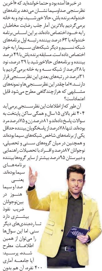
تا رده‌بندی‌های دیگر سنی، اما این سوال را می‌توان از همین اطلاعات مطرح شده، پرسید: آیا جامعه آماری ۴۰۰ نفره، آن هم بدون

اگر سرگروه شویم... ایران با توجه به کسب ۶ امتیاز از دو بازی قبلی مقابل یمن و ویتنام و ثبت تفاضل گل ۷+ هم اکنون صدرنشین گروه D محسوب می‌شود. شاگردان کی‌روش در بازی آخر مرحله گروهی حتی اگر مقابل عراق به تساوی برسند، باز هم به عنوان صدرنشین صعود می‌کنند و در غیر این صورت تیم دوم گروه خواهند بود. اگر بتوانیم با کسب امتیاز مقابل عراق سرگروه شویم، در دور یک‌هشتم نهایی با تیم سوم یکی از گروه‌های E، B یا F روبرو خواهیم شد. شرایط به این صورت است که اگر تیم سوم گروه B جزو ۴ تیم برتر سوم گروه‌های شگانه باشد، به صدرنشین گروه D بر خورد می‌کند، در غیر این صورت تیم سوم گروه E چنین سرنوشتی خواهد داشت و باز هم اگر تیم سوم این گروه هم صعود نکند، تیم سوم گروه F رقیب احتمالی ایران است. در گروه B فقط اگر استرالیا مقابل سوریه شکست بخورد، قره هدشوار برای ایران شکل می‌گیرد در این صورت فلسطین با سوریه رقیب ما خواهند بود. در گروه E لبنان و کره شمالی این شانس را خواهند داشت و در گروه F هم از بین ترکمنستان و عمان احتمالا تیم یک‌سوم می‌شود.