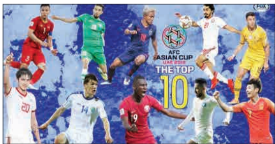
سردار آزمون در جمع برترین بازیکنان هفته دوم جام ملت‌های آسیا از نگاه فاکس اسپورت قرار گرفت.

توییت انگلیسی باشگاه آ.اس.رم به معرفی تیم فولاد خوزستان پرداخته و به شباهت‌های دو تیم اشاره کرده است: «تیم برگزیده توییت‌ر مافاسی فولاد از ایران است. این تیم همانند رم، با لباس‌های قرمز و زرد رنگ بازی می‌کند و یکی از بهترین باشگاه‌های ایران در تولید بازیکن با حضور ۴۰۰ بازیکن در آکادمی این باشگاه است. فولاد دوبار قهرمان لیگ ایران شده و فولاد آره‌نا ورزشگاه اختصاصی این تیم یکی از مجهزترین ورزشگاه‌های آسیاست.»