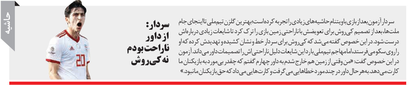
سردار: از داور ناراحت بودم نه کی‌روش

در هر اتاقی، محل‌های امن را مشخص کنید (مثلاً زیر یک میز محکم یا کنار ستونها یا دیوارهای مجاور آنها).