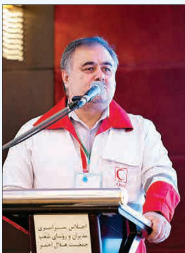
حلی ساز در ادامه به تشریح برنامه‌های این مرکز پرداخت و گفت: «طرح‌هایی برای ارایه

برمی‌گردد. در واقع هیچ کشوری به اندازه ایران خدمات خوب و شایسته به زائرانش ارایه نداده است.» وی به تفاوت‌های زبانی در سفرهای زیارتی اشاره کرد و گفت: «زائران ایرانی بشت در انتقال اطلاعات و شرح‌حال به پزشکان عرب‌زبان مشکل داشتند. حضور گسترده تیم‌های پزشکی هلال احمر به کمک زائران آمده است.»