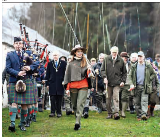
میکلور، اسکاتلند - مردم آغاز فصل ماهیگیری سالمون را جشن می‌گیرند.