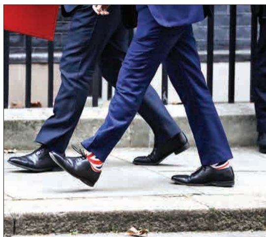
لندن، انگلستان - مت‌هانوک، وزیر بهداشت دولت ترزا می، در حال رفتن به جلسه کابینه با جورایی که نقش پرچم انگلیس را دارد.