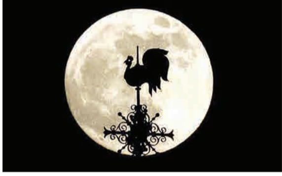
نخستین ماهگرفتنگی سال ۱۴۰۱ که به «خسوف خنوبین گرگینه» معروف شده، از ساعت ۲۰:۳۵ دقیقه بامداد دوشنبه ۲۱ ژانویه به وقت گریبونج آغاز شد و ساعت ۷:۴۵ دقیقه صبح دیروز به پایان رسید. خسوف خنوبین در بخش‌هایی از آمریکای شمالی و جنوبی، نقاطی از اروپای غربی و آفریقا به‌طور کامل قابل مشاهده بود و در برخی کشورها همچون ایران به صورت ماهگرفتنگی جزئی دیده شد. (باشگاه خبرنگاران)