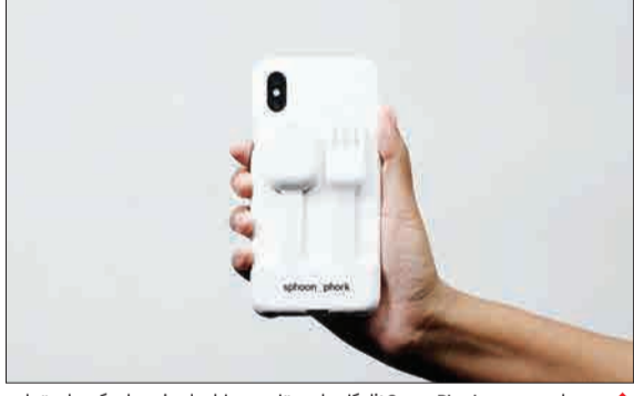
موصول موسوم به SpoonPhork نظر کاربران معتاد به موبایل را به خود جلب کرده است. این محصول شامل یک قاب اصلی است که به بدنه موبایل چسبیده و قاشق و چنگال پشت آن جامی گیرد. کاربر می‌تواند با اتصال قاشق یا چنگال، جین‌کار یا موبایل‌غذای خود را نیز بخورد (خبر آنلاین)