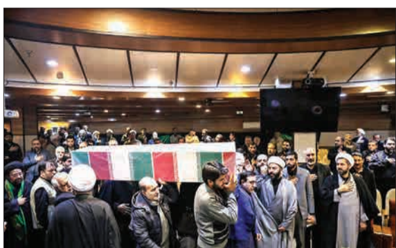
همزمان با سالروز شهادت حضرت فاطمه (س) مراسم تشییع دو شهید گمنام دفاع مقدس در نمازگاه تبلیغات اسلامی با حضور حجت الاسلام قمی رئیس و برخی مدیران این سازمان برگزار شد.