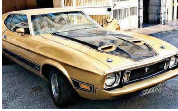
خودروی کیمیا و گر انقیمت فورد موستانگ مک وان، تولید سال ۱۹۷۰ در خیابان‌های تهران (مشرق)