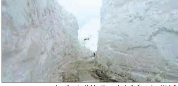
ارتفاع برف در یکی از راه‌های روستایی اطراف جاده چالوس!