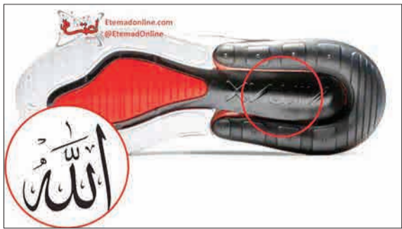
به‌تازگی شرکت نایکی مدل جدیدی از کفش‌های «ایرکس» را وارد بازار کرده که زیر آن نقشی شبیه به نام «الله» دیده می‌شود. بسیاری از مسلمانان جهان در فضای مجازی این اقدام نایکی را توهین آمیز خوانده و خواهان جمع‌آوری این محصول شده‌اند. البته یکی از سخنگوهای شرکت نایکی اعلام کرده که اعتراضات را جدی نمی‌گیریم. (اعتماد آنلاین)