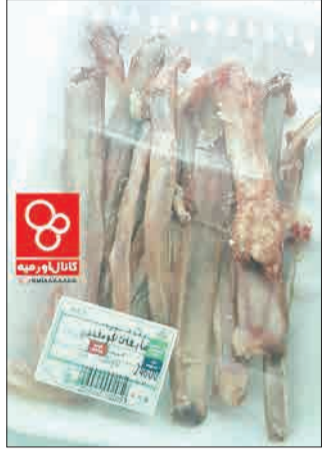
در یکی از فروشگاه‌های زنجیره‌ای ارومیه ضایعات گوشت گوسفندی کیلویی ۱۲۰۰۰ تومان فروخته می‌شود!