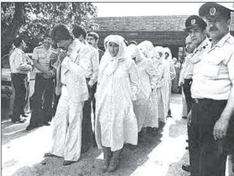
مراسم ازدواج تعدادی از زندانیان ندامتگاه قصر