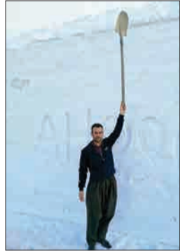
بارش ۳۰ سانتی برف در کردستان.