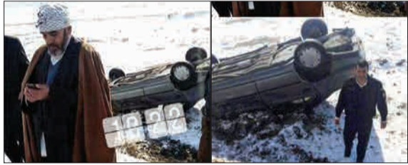
خودروی حامل امام جمعه ناهوند (همدان) در مسیر ناهوند به همدان به دلیل نامساعد بودن جاده واژگون شد. اما در این حادثه آسیبی به او و سرنشینان خود وارد نشد. (جماران نیوز)