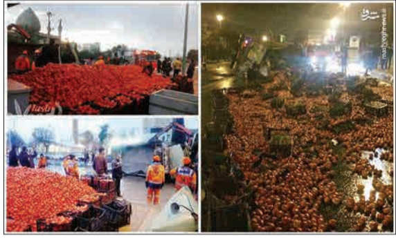
صبح دیروز در شیراز کامیونی که بار آن گوجه بود دچار حادثه و واژگون شد اما با کمک پاکبان‌ها و مردم، گوجه‌ها از روی زمین جمع شد و مردم تا رسیدن کامیون جایگزین از آنها حفاظت کردند. (مشرق)