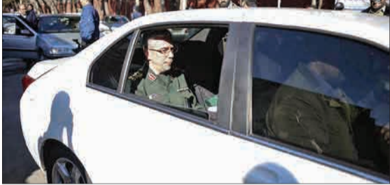
سر لشکر باقری با خودرو وی ملی «دنا» در دانشگاه هوایی شهید دستاری حضور یافت.