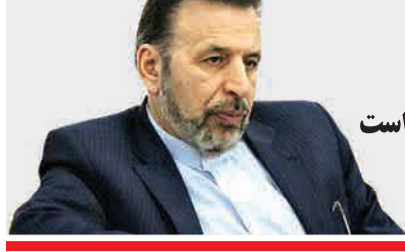
محمود واعظی؛ برجام ملاک عمل است

محمود واعظی، رئیس دفتر رئیس جمهوری در پاسخ به این سوال که در برخی رسانه‌ها میان سازو کار ساحت و اجرای گروه ویژه اقدام مالی با همان FATF پیوند داده شده، گفت: «در بیانیه سه کشور و بیانیه اتحادیه اروپا، تشکیل ساحت مشروط به الزامات FATF نشده است، ما تا کیم می‌کنیم که برجام ملاک عمل و الزامات دیگر مردود است.» او در ادامه تاکید کرد: «البته ارتباط خارجی ما وسیع و کار اقتصادی با اروپا بخش کوچکی از تعاملات اقتصادی و تجاری ما با جهان است. ما با کشورهای مختلف تعامل داریم و به گسترش روابط با همسایگان اهمیت ویژه‌ای می‌دهیم.»