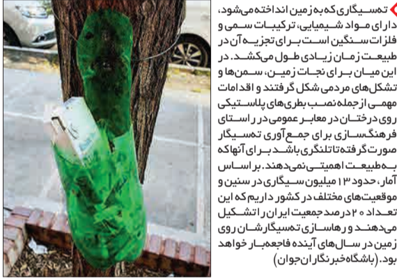
تمه‌سیگاری که به زمین انداخته می‌شود، دارای مواد شیمیایی، ترکیبات سمی و فلزات سنگین است. برای تجزیه آن در طبیعت زمان زیادی طول می‌کشد. در این میان برای نجات زمین، سمن‌ها و تشک‌های مردمی شکل گرفته‌اند و اقدامات مهمی از جمله نصب بطری‌های پلاستیکی روی درختان در معابر عمومی در راستای فرهنگ‌سازی برای جمع آوری تمه‌سیگار صورت گرفته تا تلنگری باشد برای آت‌ها که به طبیعت اهمیت نمی‌دهند. بر اساس آمار، حدود ۱۳ میلیون سیگاری در سنین و موقعیت‌های مختلف در کشور داریم که این تعداد ۲۰ درصد جمعیت ایران را تشکیل می‌دهند و راه‌سازی تمه‌سیگارشان روی زمین در سال‌های آینده فاجعه‌بار خواهد بود. (باشگاه خبرنگاران جوان)