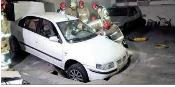
دوشنبه شب ششست‌مین در قسمت چهار کینکسک ساختمان مسکونی در خیابان جنت آباد جنوبی، سبب فرورفتن سمندر زمین شد. آتش نشانان با تجهیزاتی از جمله پمپ‌ها و وات‌تکران خود رو کردند. سپس با استفاده از انوار و قرار دادن آن در زیر خودرو، این وسیله نقلیه را کاملاً از گودال خارج کردند.