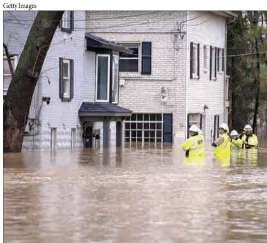
لوئیس ویل، آمریکا-تکنیسین های گاز و برق به دلیل سیل ناشی از طغیان رودخانه اوهایو در حال قطع کردن گاز و برق هستند.