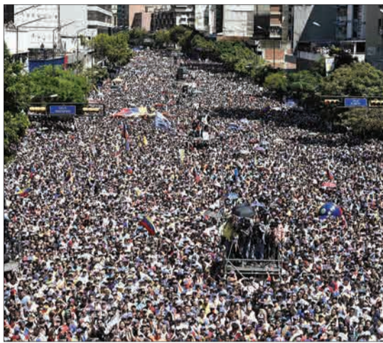
کاراکاس، ونزوئلا-تظاهرات در حمایت از گویدو، رئیس جمهوری خودخوانده ونزوئلا در پایتخت این کشور.