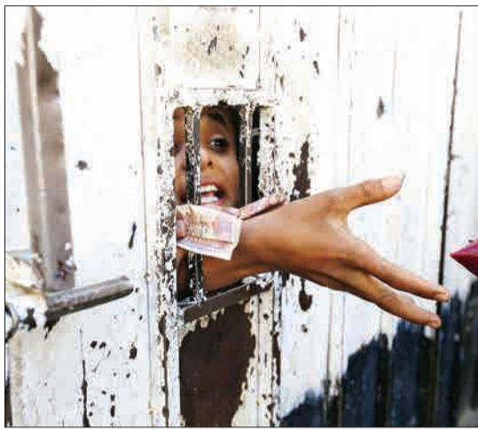
صنعا، یمن - دانش آموزان مدرسه از شکاف در مدرسه بستنی می‌خرند.