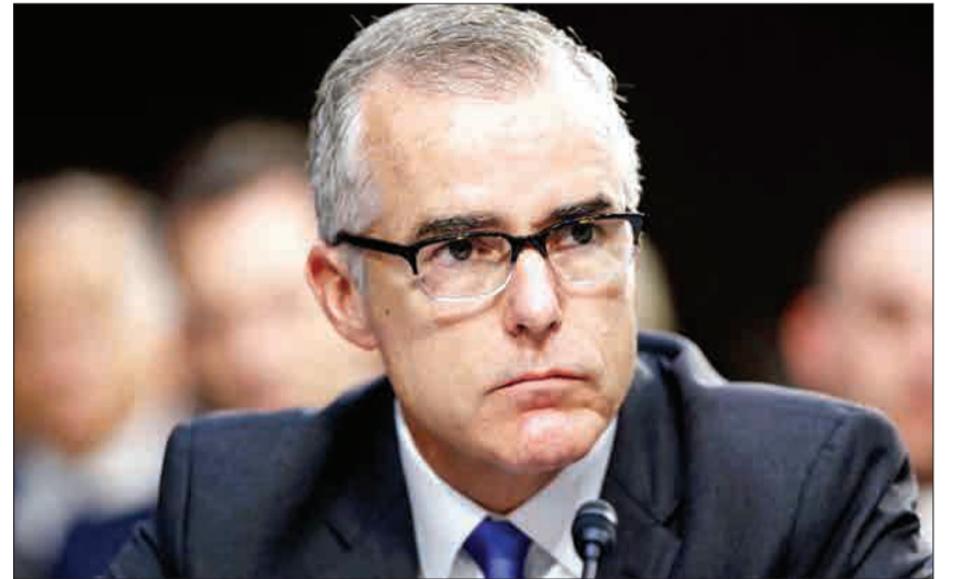
معاون مدیر سابق اف‌بی‌آی: