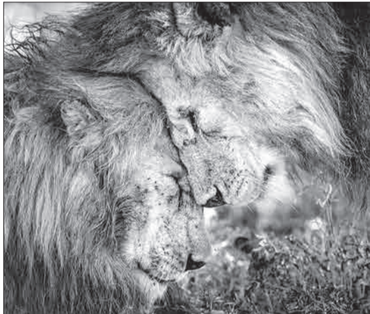
برنده بهترین عکس سال در حوزه حیات وحش