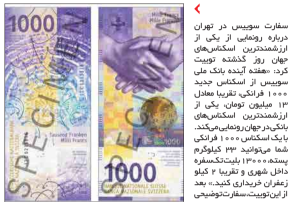
سفارت سوئیس در تهران درباره رونمایی از یکی از ارزشمندترین اسکناس‌های جهان روز گذشته توییت کرد: «هفته آینده بانک ملی سوئیس از اسکناس جدید ۱۰۰۰ فرانکی، تقریباً معادل ۱۳ میلیون تومان، یکی از ارزشمندترین اسکناس‌های بانکی در جهان رونمایی می‌کند. شما می‌توانید ۳۳ کیلوگرم پسته، ۱۳۰۰۰ بلیت تک‌سفره داخل شهری و تقریباً ۲ کیلو زعفران خریداری کنید.» بعد از این توییت، سفارت توضیحی در این‌باره ارائه داد و نوشت: