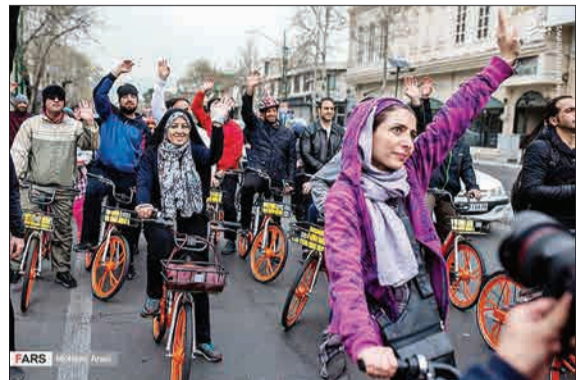
همایش بزرگ دوچرخه‌سواری صبح روز گذشته با حضور علاقمندان دوچرخه‌سواری از میدان انقلاب شروع شد و تا میدان راه‌آهن ادامه پیدا کرد.