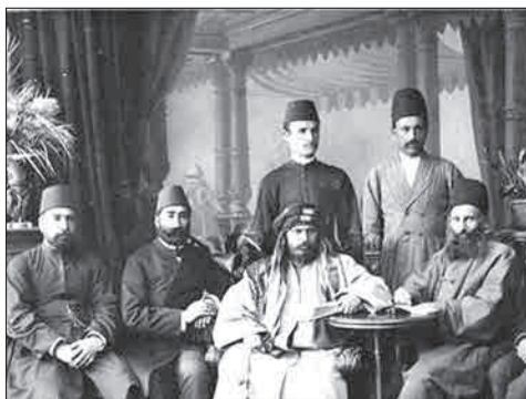
سیدجمال در قلمرو عثمانی

سید جمال‌الدین اسدآبادی از مبلغان اسم و رسد دار و پیشرو اندیشه اتحاد اسلام بود. بر اساس این اندیشه هر گونه پیوند با مبین و قومیت باید با پیوندهای فراملیتی اسلام و اتحاد بین مسلمانان، جایگزین شود. سید جمال با شناسایی ضعف و دردهای مسلمانان، در طول حیات خود نسبت به مبارزه با عوامل عقب‌ماندگی جوامع اسلامی همت گماشت و همواره به دنبال راه‌حلی برای مقابله با