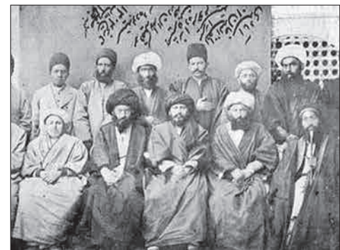
سیدجمال در ایران