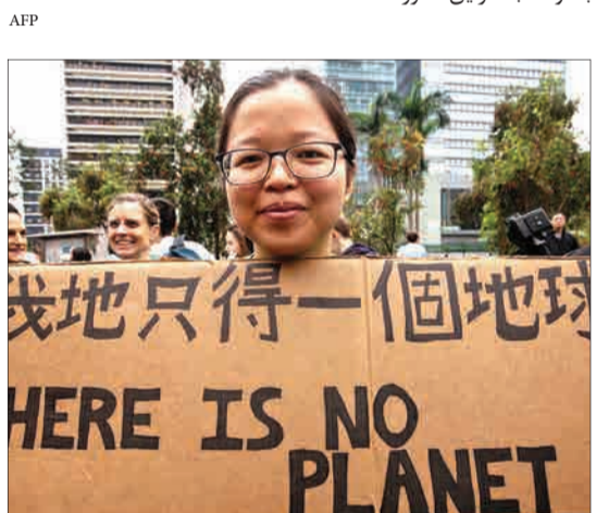
هنگ کنگ، چین - اعتراض دانش‌آموزان سراسر جهان به سیاست‌های نادیده گرفتن وضع گرمایش زمین. دانش‌آموز چینی پلاکاردی در دست گرفته که روی آن نوشته: «هیچ سیاره دیگری نداریم.»