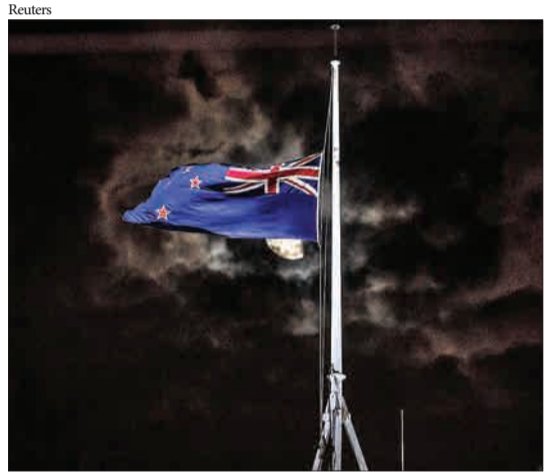
ولینگتون، نیوزیلند - پرچم نیمه‌افراشته پارلمان نیوزیلند پس از حمله تروریستی به دو مسجد در این کشور.