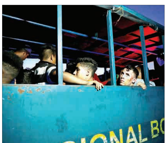
کاراکاس، ونزوئلا- افرادی که به دلیل شرایط سخت اقتصادی، دست به دزدی از مغازه‌ها زده و دستگیر شده‌اند.