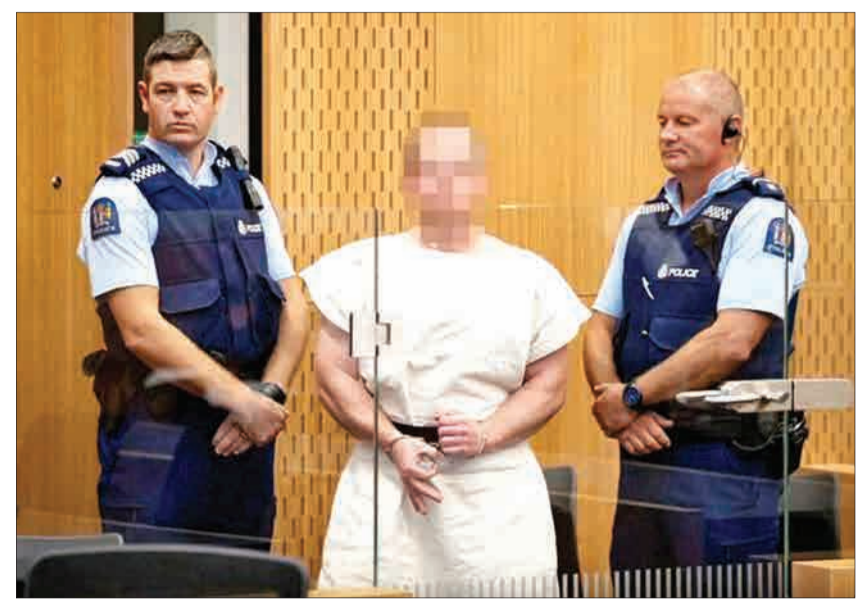
پیام‌هایی که ترنت با انگلستان خود از طریق عکاسان قاضی دادگاه مخبره کرد