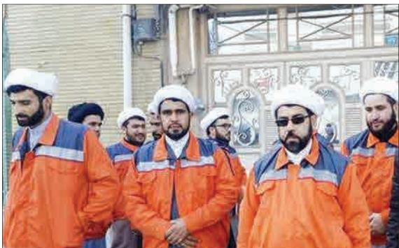
طلبه‌هایی که قرار است به شکل جهادی وظیفه‌بری‌های پاکبان‌ها را که برای انجام وظیفه به جای دیگری منتقل شده‌اند، انجام دهند. (مشرق)