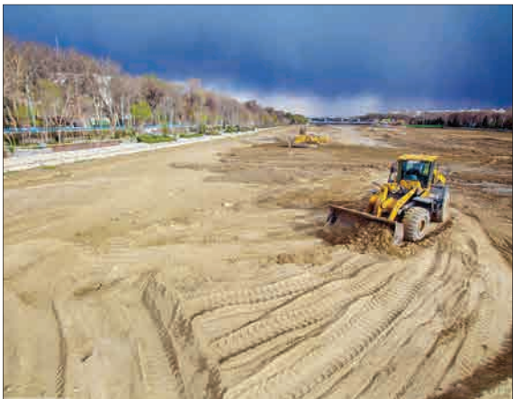
بازگشایی رودخانه زاینده‌رود در آستانه‌سال جدید. آماده‌سازی و لایروبی کف رودخانه توسط سازمان خدمات موتوری شهرداری اصفهان در حال انجام است.