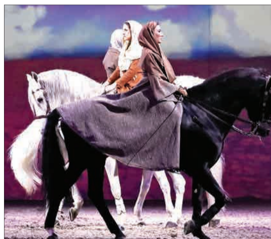
بروکسل، بلژیک - نمایش اسب‌سواری در فستیوال کلاولونا.