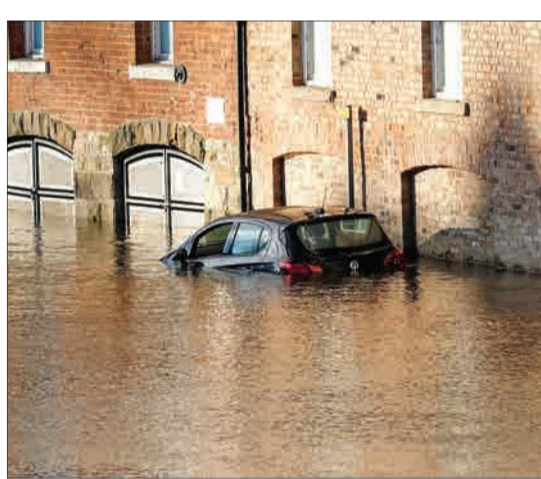
یورک، انگلیس - باران شدید در شهر یورک در انگلیس باعث طغیان رودخانه‌ها و آب گرفتگی در این شهر شده است.