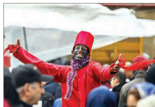
ساعات منتهی به تحویل سال نو | علی تقوی - ایستا