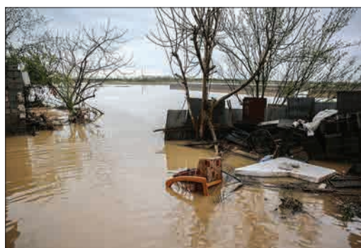
سیل در روستای حسن آباد در مازندران | مهر