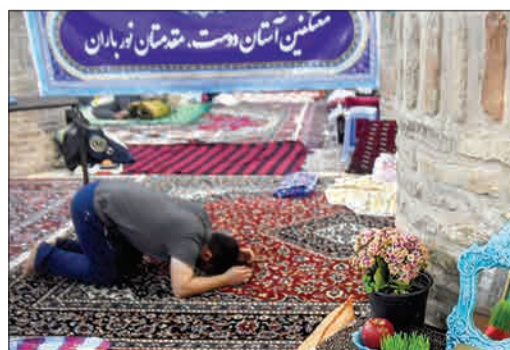
مراسم اعتکاف در سمنان