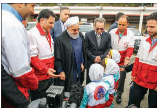
استقبال غنچه‌های هلال از رئیس‌جمهور در بازدید از پایگاه چیتگر