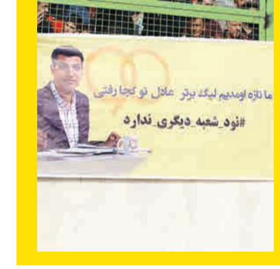
ما تازه اولین لیگه بزرگ ما را تو دنیا رفتی #نود شعبه دیگری ندارد