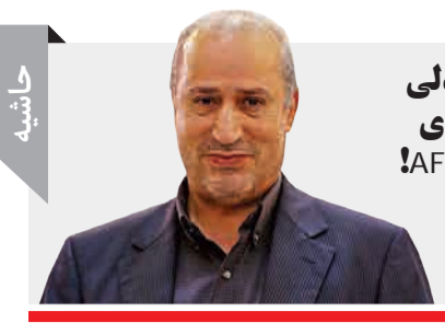
تاج روی صندلی کفایشان؛ آقای نایب رئیس AFC!

باز گشت تلویزیون به فضای پیام‌سان تلگرام در روزهای اخیر در فضای مجازی جلب توجه فراوانی کرده و واکنش‌های گسترده و پر دامنه‌ای را موجب شده است. ماجرا وقتی رسانه‌ای شد که دیدیم در اطلاع‌رسانی‌های صداوسیما درباره واقعه سیل امسال دوباره پای کانال‌های تلگرامی صداوسیما نیز به تصاویر باز شده است. این اتفاق خبری مهم که نشان از شکست سیاست‌های دستوری داشت، خیلی زود موج شد و در فضای مجازی دست‌به‌دست شد. با این مضمون که «صداوسیما برای انتقال اخبار واقعه سیل، بار دیگر به تلگرام بازگشته». این اتفاق البته می‌توانست اتفاقی معمولی باشد، ولی اگر در نظر آوریم که این سازمان در ماه‌های گذشته، چه قدر در ترویج خبر سان سروس و کوشید و چه مبالغ زیادی صرف ترویج این خبر سان شده؛ آن وقت است که باز گشت صداوسیما به پیام‌سان تلگرام تبدیل به خبری مهم می‌شود. شاید به دلیل اهمیت این خبر باشد که مجریان صداوسیما، از عبارت «تلگرام» استفاده نمی‌کنند و روی آنتن، نامی از این خبر سان فیلتر شده، به میان نمی‌آید. دیروز کاربران زیادی به این موضوع واکنش نشان دادند. از جمله کاربری که نوشت: «صداوسیما به تلگرام برگشت، درست مانند فارس و بقیه. چه زمانی قراره بفهمیم که نمی‌توان برای مردم تعیین تکلیف کرد؟ چه زمان می‌فهمیم مردم اهمیت دارند؟» واکنش‌ها البته مضامین متفاوتی داشتند. مثلاً یکی که به یکی از موضوعات روز تلویزیون نیز کنایه زده بود: «تفکری که می‌خواد فوتبال برتر رو جانشین نود کنه، شبیه همون تفکریه که در ابتدای فیلترینگ تلگرام قصد داشت پیام‌سان‌های داخلی مثل سروس و جابگیر این شبکه اجتماعی پر مخاطب کنه». اما به قول کاربری: «اینکه فهمیدن با پول همیشه همه کاری کرد خودش به اتفاق قشنگه...»