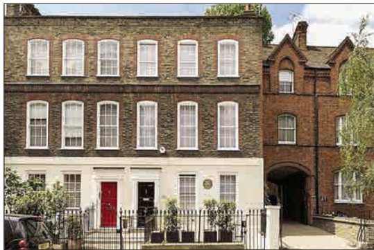
تصویری از منزل مسکونی ولفگانگ آمادئوس موتسارت آهنگساز معروف دوره کلاسیک در لندن که به قیمت ۷ میلیون و ۵۰۰ هزار پوند فروخته شد.